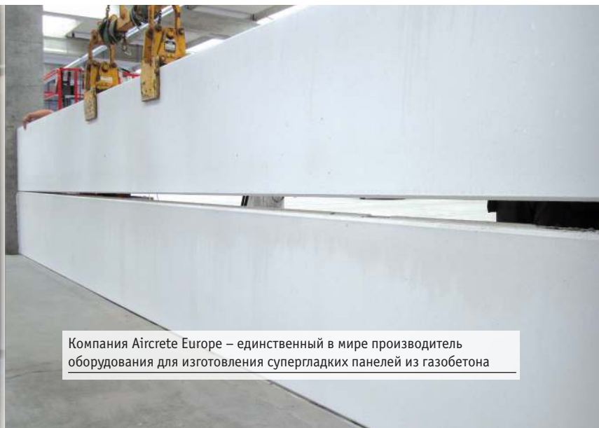
Компания Aircrete Europe – единственный в мире производитель оборудования для изготовления супергладких панелей из газобетона