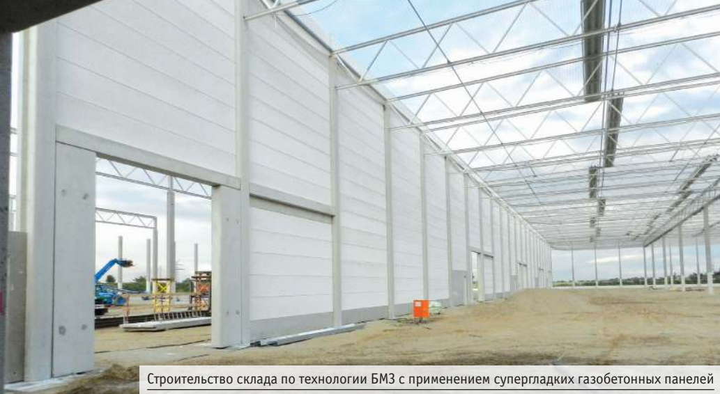
Строительство склада по технологии БМЗ с применением супергладких газобетонных панелей

Сегодня на пик популярности вышли крупноформатные панели с супергладкой поверхностью, которые сочетают все плюсы газобетона как энергоэффективного материала и технологий сборного быстромонтируемого строительства. Таким образом, на практике реализуется заветная мечта – строить быстро, энергоэффективно, экологично, легко и в то же время недорого.