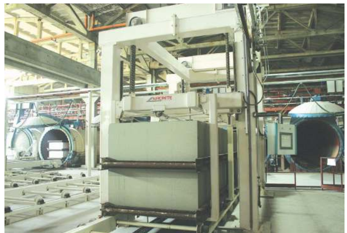
Самый большой завод в Восточной Европе – «Энерджи Продакт», Украина. Высокоскоростная резательная линия (с двумя струнами) и горизонтальное автоклавирование позволяют сделать поверхность любой продукции Aircrete супергладкой