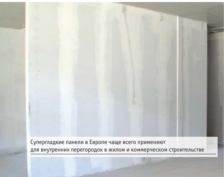
Супергладкие панели в Европе чаще всего применяют для внутренних перегородок в жилом и коммерческом строительстве

В Нидерландах работают три крупных завода по производству газобетонных изделий, при этом каждый из них имеет свою специализацию. Один выпускает исключительно блоки, другой – армированные изделия, а третий сконцентрирован